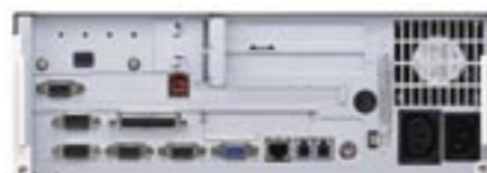
▲ Conectividade avançada

A TOSHIBA TEC e as novas características do ST-7000 permitem reduzir o custo total de propriedade (TCO). Os utilizadores podem utilizar e proteger o seu investimento em periféricos de TPV existentes e, com os USBs disponíveis, ter uma plataforma de hardware que prevê e cobre as necessidades que podem surgir no futuro. O sistema foi concebido para uma fácil instalação, necessitando apenas de uma só tomada de alimentação. As novas portas USB alimentadas facilitam a ligação e substituição de periféricos TPV. Os módulos deslizantes (SOM) foram concebidos para minimizar tempos, reduzir o custo total de manutenção e melhorar a produtividade do checkout.